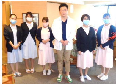
海生院長とスタッフ

また、地域医療に貢献したいという思いを持っておりまして、この地域の医院としては珍しいのですが在宅診療をおこなっており、力を注いでおります。