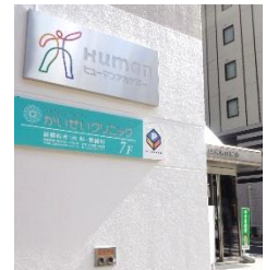
借成ビルの7Fにあります

初めて来院される患者さまは、緊張されていることが多いです。病気や体調の不安のせいだけでなく、初対面の医師を相手にするわけですから、自分の思っていることをうまく言い出せないこともあるかと思います。そういったときは、ちょっとした手品や寸劇、世間話などで場を和ませるようにしています。男性や女性、小さいお子さまなど、来院された患者さまに合わせて、リラックスしてお話できるような環境づくりやアプローチを心がけています。