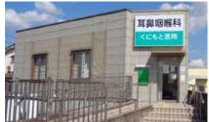
耳鼻咽喉科くにもと医院外観

耳や鼻の病気も早期に治療を開始すると治りが早いです。また、口の中の癌、首の癌は耳鼻咽喉科で診断治療します。お気軽にご相談下さい。