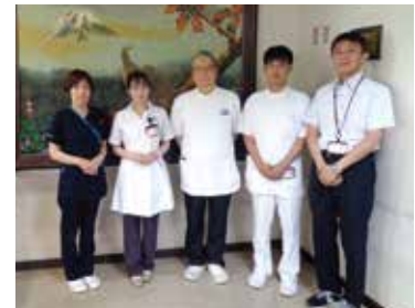
南海田病院スタッフ

患者様やご家族としっかりコミュニケーションを取ることで。患者様は聞きたいことがあっても遠慮されることが多く、言い出せない方が多いと思います。診察の際は、雑談も交えながら、相談しやすい雰囲気作りを心がけています。また入院中の患者様の回診は毎日必ず行い、小さい変化でも気付けるようにしています。また、スタッフとは常日頃から積極的にコミュニケーションを取るようし、“聞きやすい・言いやすい”関係性を築いていきたいと思っています。