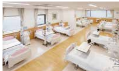
ベッド間のスペースにゆとりがあり、快適に過ごせる透析室

開院以来とてもお世話になっております。透析患者さんは合併症を持っておられることが多く、県病院のほぼすべての科にご紹介させて頂いています。腎臓内科をはじめ、移植外科には献腎移植登録、件数は少ないですが生体腎移植をお願いし、大変お世話になっております。婦人科疾患、乳腺外科にも多くの患者さんを紹介させて頂き通院させて頂いています。また、先月は循環器内科に心筋梗塞の患者さんの紹介でお電話をさせて頂いた際は『すぐに送ってください、湾岸道路であれば15分で到着します』とアドバイスを頂きました。日ごろのご配慮に感謝申し上げます。