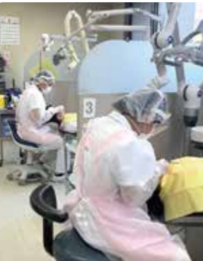
手術前は専門的ケアをします

お口の中には、歯垢1gに数千億個(便と同等、唾液は1億個)程度の細菌がいると言われています。お口は体の入り口です。お口の細菌や毒素が体の中(肺や血液・消化管)に入ること、誤嚥性肺炎や術後の手術創の感染などを引き起こし、命に関わる可能性があります。