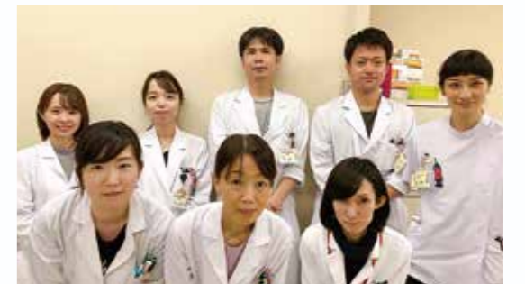
薬剤科スタッフです

手術後は、各病棟の担当薬剤師が医師や看護師などの病棟スタッフと連携し、痛みや吐き気の症状コントロールを行います。痛みや吐き気のコントロールをしっかりと行うことで、早期離床・早期回復を目指しています。また、手術前に一時的に中止となったお薬の再開の確認も行い、退院に向けたサポートを行っています。