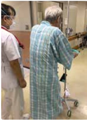
しっかりサポートいたします

手術をされた後、痛みやしんどさで動くことができずに筋力や体力の低下を引き起こすことがあります。また、呼吸がしづらくなったり痰が溜まりやすくなることもあります。このような合併症を予防するためには手術後だけでなく、手術前からのリハビリが重要です。当院では、すい臓の手術と肝臓の手術の一部の方を対象に、入院2週間前にご自宅で行うトレーニングや呼吸の練習方法を説明します。手術後は、お体の状態に合わせて翌日から立ったり歩いたり、主治医の指示に従ってベッドから離れるところからリハビリを始めます。術後、動いてよいのか不安や心配があると思いますが、リハビリスタッフと看護師がしっかりサポートさせていただきます。