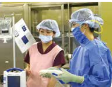
手術室での麻酔科看護師

手術を受ける患者さん、ご家族にとって不安は計り知れないものと思います。麻酔科外来で手術室看護師は、少しでも不安が軽減され、安心して手術に臨んでいただけるよう、麻酔科医師と共に患者さんの状態を確認し、十分な説明をさせていただきます。気になること、心配なこと、ご要望は遠慮なくお知らせください。