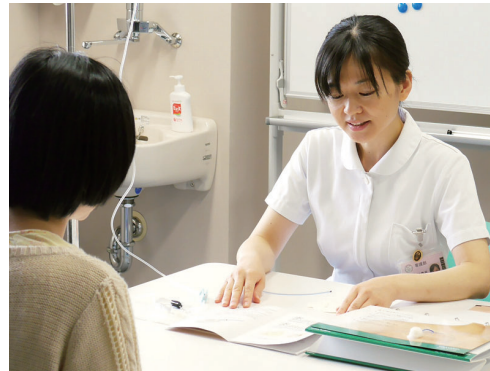
がん看護専門看護師による説明の様子

生まれ持った病気に関する体質については、知りたいと思う方もおられれば、不安に思う方もおられるかもしれません。問題を整理したり、どうしたらよいか一緒に考えたりする機会を提供させていただいています。