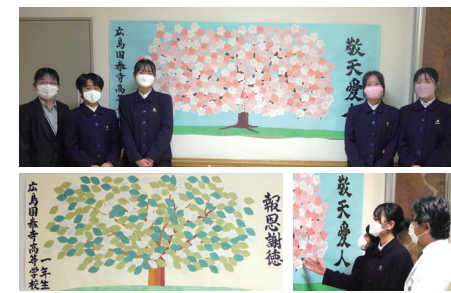
素敵な作品とメッセージをありがとうございました

作品は一般の方にも見て頂けるように、南棟に向かう中央棟1階通路に5月12日まで掲示させていただきました。