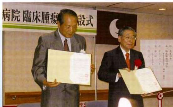
▲国立がんセンター中央病院とのがん診療に係る覚書調印式

さらに、国立がんセンター中央病院と連携を取り、同センターのご支援をいただきながら、最新のがん治療を提供していきます。