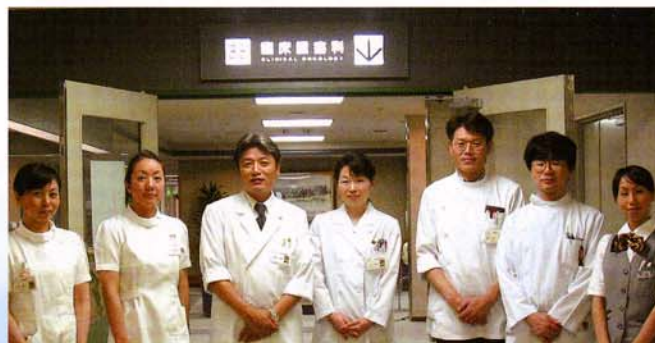
▲臨床腫瘍科のスタッフ