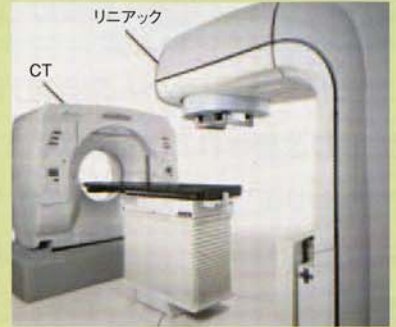
▲図1:リニアック・CT同室設置『FOCALユニット』