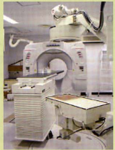
▲図2:照射位置決め装置