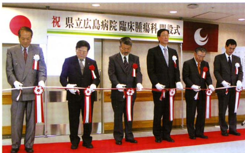
▲平成18年7月20日 臨床腫瘍科開設式

がん治療の基本は、手術療法、化学療法、放射線療法で、その他にホルモン療法、遺伝子療法、免疫療法、温熱療法などが試みられています。これら