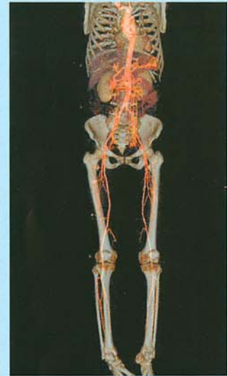
▲胸部・腹部・下肢動脈(図2)