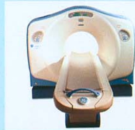
▲64列マルチスライスCT外観(図1)

心臓カテーテル検査は、患者さんには、大変負担のかかる検査ですが、この64列マルチスライスCTによる検査では、患者さんの身体に触れることがないので出血などの危険もなく、短時間で検査ができるため心疾患の検査として格段に利用していただきやすくなるものと思います。心臓カテーテル検査との違いは表1をご参照ください。