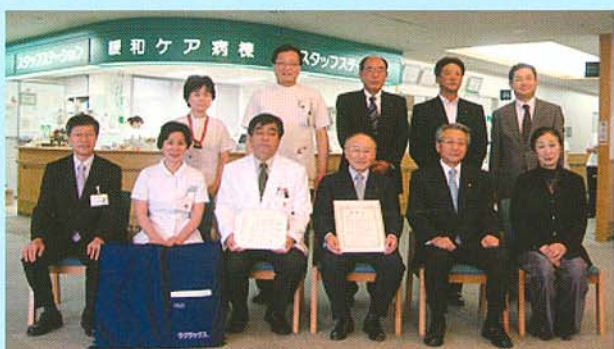
広島東南ロータリークラブ様から、患者様の移動時の利便性向上と医療スタッフの労力軽減とを図るとの御厚意により、患者移動用マットを寄贈していただきました。(平成21年9月30日)

今後とも、当院の運営に引き続き、ご支援、ご協力を賜りますよう、よろしくお願い申し上げます。