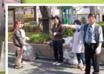
院長先生も一緒です