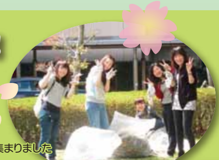
こんなに集まりました