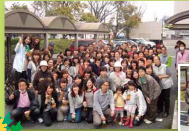
参加メンバーです