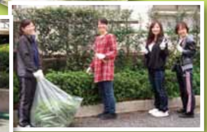
植木の刈り込みをしています