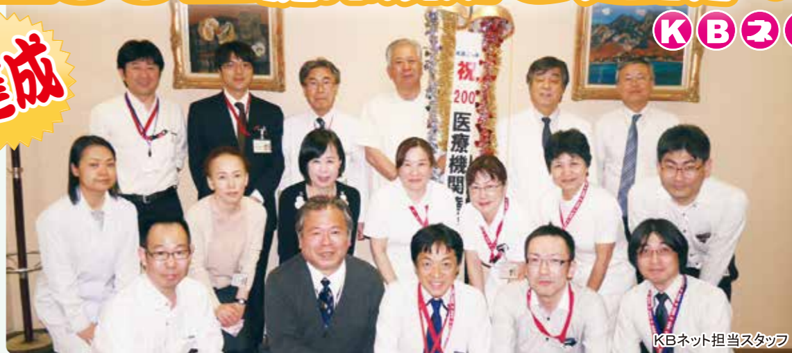
KBネット担当スタッフ