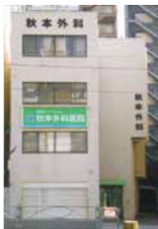
秋本外科医院外観

当院には19床のベッドもありますので、入院での受入も含めます。連携を深めていきたいと思っております。