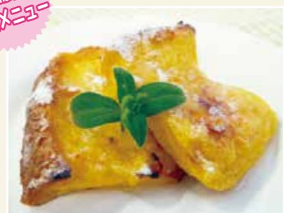
オレンジフレンチトースト