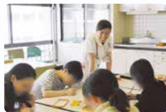
レクリエーション風景

南7病棟は、精神神経科の病棟です。疾患としては統合失調症、うつ病、双極性障害、摂食障害の若年層から高齢層まで様々な患者さんが入院されています。薬物療法を中心に環境調整や生活支援を行っています。また総合病院の中にある精神神経科病棟であるため、手術や内科・外科的処置を必要とされる身体合併症を有する患者さんのチーム医療も行っています。スタッフは患者さんの権利を尊重し、倫理観を大切にし、患者さんが安心して生活できるよう寄り添い、納得ができる医療の提供に努めています。笑顔で退院を迎えられるよう他職種を含めたスタッフ間で話し合い(カンファレンス)を行い、退院支援をしています。