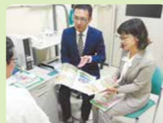
医療機関への訪問

医療機関や様々な保健・福祉サービス機関との連携の窓口として、患者さんが地域の中で安心して継続的に医療を受けられるよう、関係医療機関とのネットワークづくりに努めております。また、看護師や医療ソーシャルワーカーなどの相談員が患者さんをはじめ、皆さまからのご相談やご意見をお伺いしております。