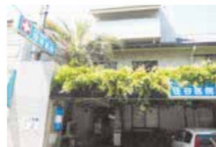
住谷内科・消化器内科・リハビリテーション科外観

大学時代の友人が県病院に多くいたので、気軽に紹介でき、今も紹介患者の大半は県病院へ紹介しています。