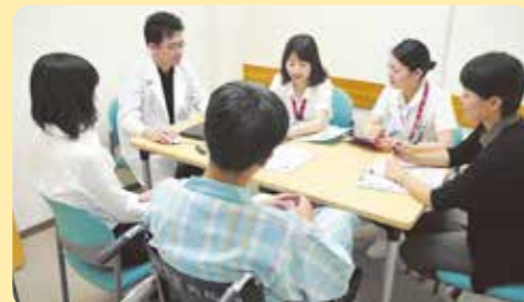
患者さんの退院に向けた話し合いの様子 (カンファレンス)