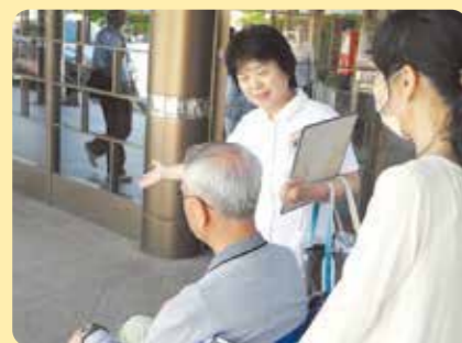
入院サポート担当

患者さんが安心して治療を受けることができるよう、入院前からサポートいたします。また、退院後の療養環境など、退院に伴う患者さんやご家族の方の不安や心配事の解決に努めます。