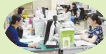
医療機関からの受診予約を扱う病診連携担当